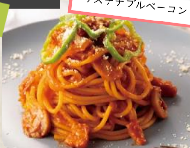
サステナブル ナポリタン