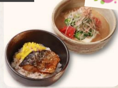
もち麦ごはん 焼き鯖の冷やし汁