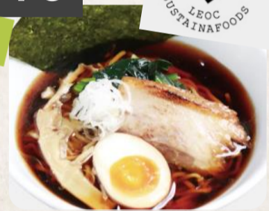
ブラック醤油ラーメン