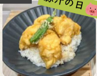
YEBISU GARDEN CAFE特製 鶏天丼