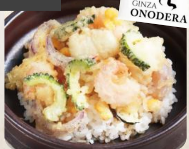
天ぷらおのぞら監修 季節のかき揚げ丼