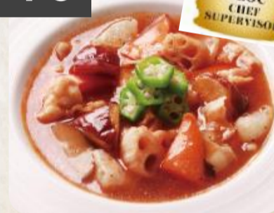
香辣根菜豆腐 焼き豆腐とゴロゴロ野菜の 旨辛あん