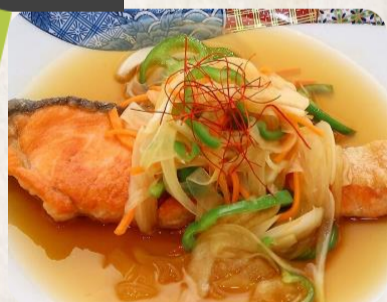
宙ベジピーマン使用 鮭と彩り野菜の黒酢南蛮