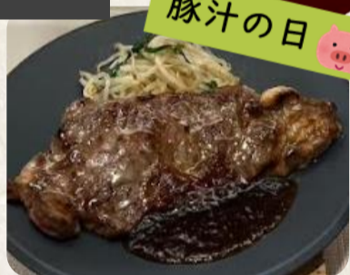
サーロインステーキ