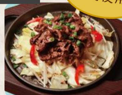
北海道産牛肉の塩だれ炒め