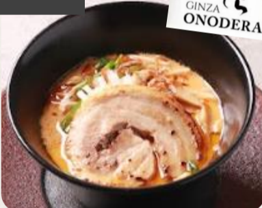
銀座おのぞら監修 濃厚海老味噌ラーメン