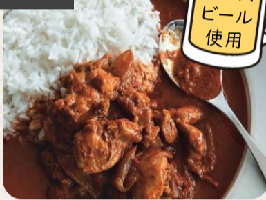
YEBISU GARDEN CAFÉ オリジナル ポークビンダルー