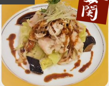
芝蘭監修 辣白片肉(ラパッピンヨ)