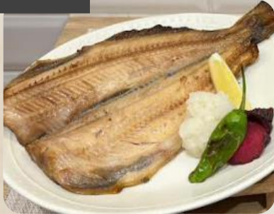
大判! 縞ホッケの一夜干し