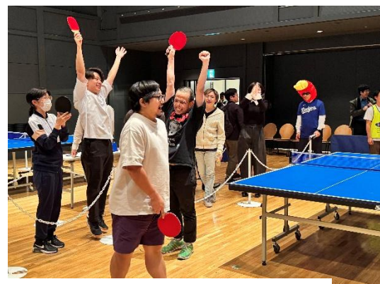
得点した時の喜び