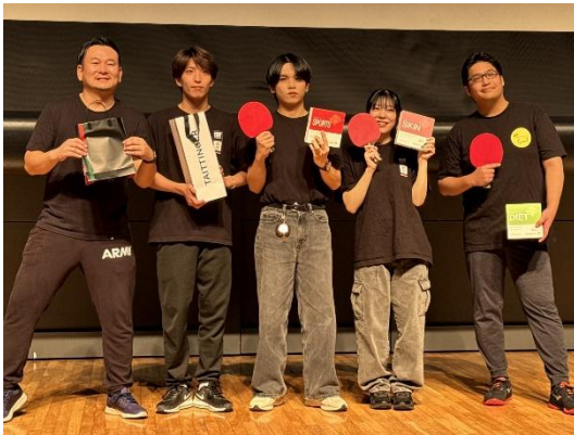
優勝した株式会社情報戦略テクノロジー