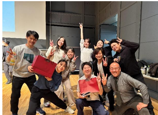
特別賞「ひらめき賞」を受賞した3チーム