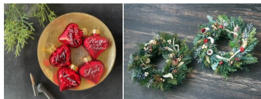
「abatino」販売商品例（時計広場）

国内の様々なクリエイター作品を週替わりで紹介するコーナーではクリスマス限定の作品なども登場。併設のコーナーではフランス、北欧など、世界各国のクリスマスギフトをご用意します。