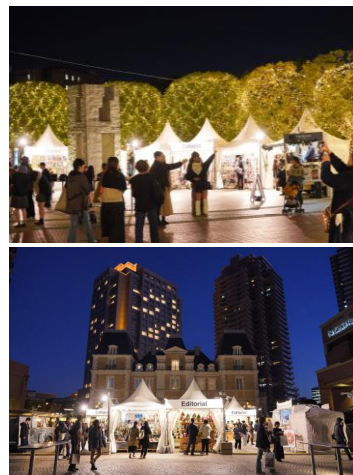
＜過去開催時の様子＞