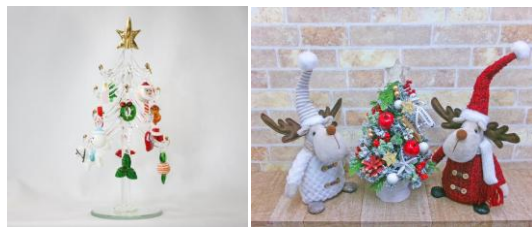
「Editorial」販売商品例(時計広場)

「雑誌を編集するように売場を編集する」をコンセプトにした、ライフスタイル雑貨のセレクトショップ「Editorial」が、時計広場のクリスマスマルシェに出店。クリスマスを彩るリース、スノードームやハンドメイドアクセサリ、マフラーなどのギフトアイテムまで幅広く取り揃えています。