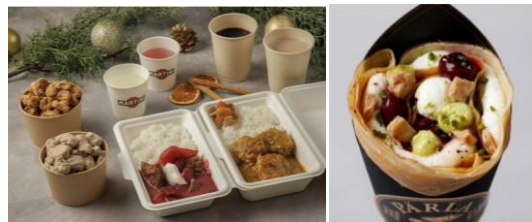
左：「ウェスティンホテル東京・フードトラック」販売商品例（時計広場） 右：「PÄRLA」販売商品例(シャトー広場)

寒い季節にぴったりの温かいメニューとして、トマトとビーツの旨みが凝縮された濃厚な「ボルシチ」。さらに、リンゴとシナモンが香る「ホットワイン」など、心も体も温まるフード＆ドリンクをお楽しみいただけます。