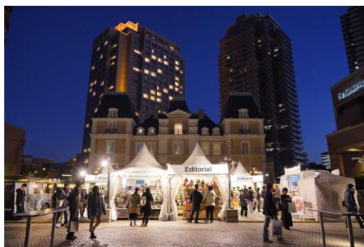
「クリスマスマルシェ (シャトー広場)」

恵比寿ガーデンプレイス(所在地：渋谷区恵比寿4丁目)は、2025年11月8日(土)から2026年1月12日(月・祝)まで、「灯る、きらめく。」をテーマにイルミネーションイベント「Baccarat ETERNAL LIGHTS-歓びのかたち-」を開催します。初日の11月8日(土)17：00より、 お客様と共に世界最大級のシャンデリアの明かりを灯す、点灯式 を行います。