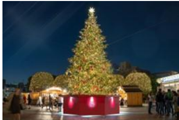
＜過去開催時の様子＞