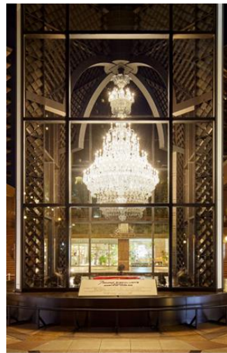
＜世界最大級のバカラシャンデリア＞