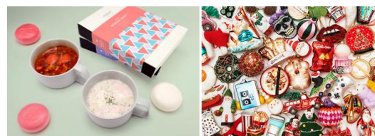
「Editorial」販売商品例(シャトー広場)

自社農場で種から育てた新鮮で鮮やかな旬の野菜を使い、心から温まるスープを提供します。「農場から食卓へ、農場からイベントへ」という、他に類を見ない体験をご提供します。