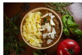
イルジェンティーレ