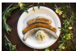
ハヤリソーセージ