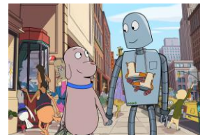
『ロボット・ドリームズ』 ©2023 Arcadia Motion Pictures S.L., Lokiz Films A.I.E., Noodles Production SARL, Les Films du Worso SARL