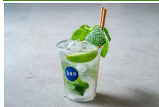
ブルーノート・プレス

6/6～8：ベリー&ローズ、6/13～15：柑橘カスタード 6/20～22：塩キャラメル、6/27～29：テラミス、7/4～6：トロピカルソース