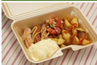
デリカテッセン ヤマブキ

ブラックココアを使用したコクのある真っ黒なチーズケーキ。姉妹店コマグラカフェで人気のケーキを期間限定でお楽しみいただけます。