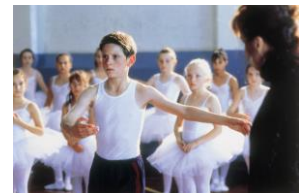
『リトル・ダンサー』