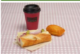
ラ ブティック ドゥ ジョエル・ロブション