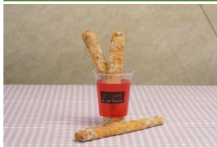
ラ ブティック ドゥ ジョエル・ロブション

初夏に野外で映画を観ながら飲みたくなるシェイクです。瀬戸内レモンのピールが入った酸味のあるヨーグルトシェイクはさわやかに召し上がりたい方におすすめ！