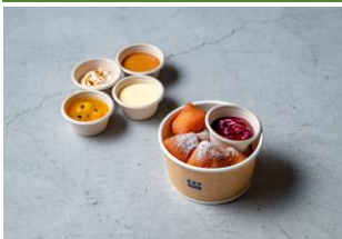
ブルーノート・プレス

ハラペーニョ唐辛子にオリーブやチーズを合わせたパン。映画を観ながらでも食べやすいスティック形です。ピールなどのおつまみとしてもおすすめです！