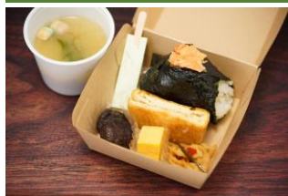
福の蔵 by お福酒造

マイスター（ハムソーセージ職人）が選ぶ自然が育む豊かな食材とミネラル豊富な水でひとつひとつ手作りされた信州小諸の自然派ソーセージ。旨味たっぷり。ジュシーなソーセージをとろ〜りチーズでどうぞ！