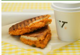
ヴァーヴ・コーヒー・ロースターズ

ご予約はこちら： https://www.tablecheck.com/shops/robuchon-laboutique-ebisu/reserve