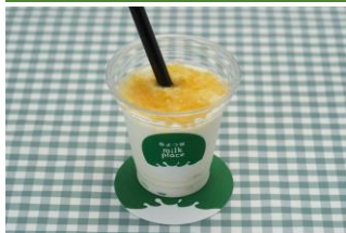
よつ葉ミルクプレス

『PICNIC CINEMA』開催中しか味わえない限定グルメを是非味わってみてはいかがでしょうか。