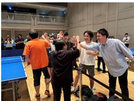
健闘を称え合いハイタッチ