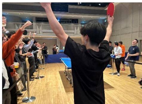
得点した時の喜び