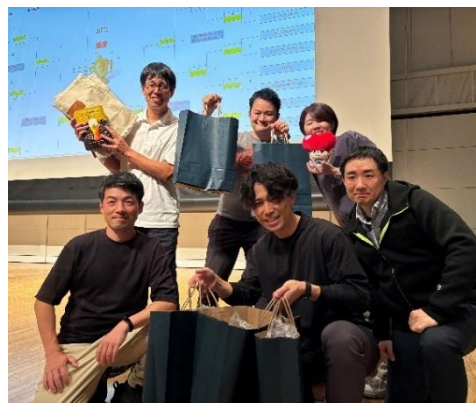
特別賞を受賞したリーフラス株式会社