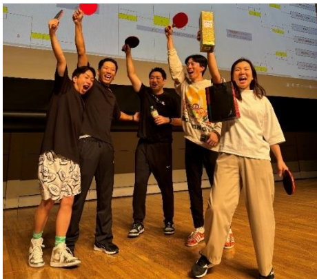
優勝したサーブコープジャパン株式会社