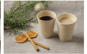
「ウェスティンホテル東京」商品販売例