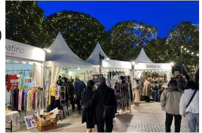
＜過去開催時の様子（時計広場）＞