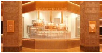
<YEBISU BREWERY TOKYO>

恵比寿ガーデンプレイスではバカラのシャンデリアが輝く美しい季節に、「YEBISU BREWERY TOKYO」でつくられ、ここでしか飲めないフレンチHAZY IPAスタイルのビール「Velvet twilight（ベルベット トワイライト）」を限定発売します。クリスマスにちなんだ限定ビールも発売予定なのでご期待ください。