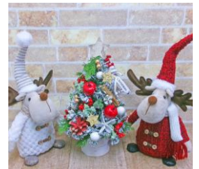
「Editorial」シャトー広場商品販売例