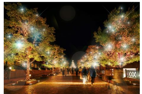
＜坂道のプロムナード (イメージ)＞