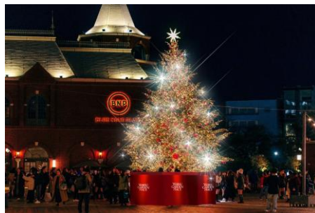
＜クリスマスツリー (イメージ)＞