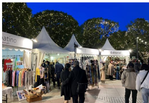
「クリスマスマルシェ（時計広場）」