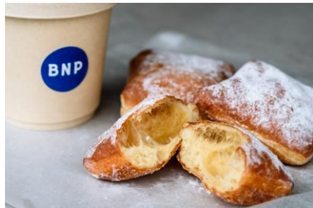
<販売商品例（ベニエ）>