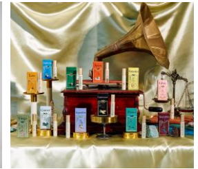
「Editorial」時計広場商品販売例