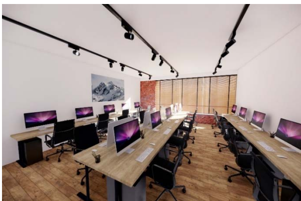
▲プライベートオフィスイメージ

1名から利用可能なフリーデスクプランは、会員専用の集中できる空間を確保しつつ、入居者専用のラウンジや会議室、仮眠室など、充実した共用部をも利用可能。法人の住所登記・ポストも利用することができます。