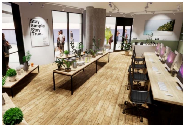
▲ショールームオフィスのレイアウトイメージ

ガラスの壁で囲まれた空間で、企業独自の雰囲気を作り上げることができ、店舗兼事務所として利用可能です。