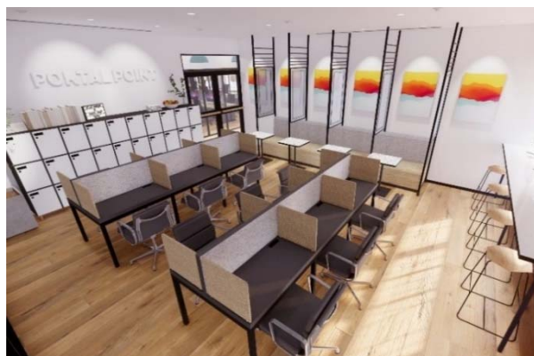
▲フリーデスクスペースイメージ