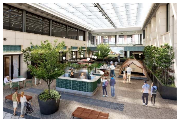
▲コミュニティラウンジイメージ (イベント利用時)

施設の中心に位置する約 320 m 2 のコミュニティラウンジは、8.6mもの開放的な吹き抜けのガラス張り天井で、リラックスしながら仕事や打合せができる空間。一角では展示会やワークショップ、ヨガなどのイベント利用も可能で、入居者のみならず周辺ワーカーや地域住民との「交流」の場所として利用できます。