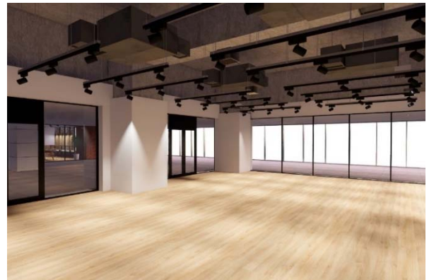
▲ポップアップスペースイメージ

スカイウォークを出てすぐの視認性が良い場所に位置する短期間型のショップ&ショールームスペース。シンプルな内装とスケルトンの高い天井は、様々な業種のプロモーションに有効な空間。交流型のワークショップやクリエイティブな新商品、サービスを扱うポップアップストアとして利用いただけます。