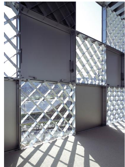
▲アルミ製ラチスパネル

ショーケースでは、厚いラチスパネルを柱のように利用することで、シャンデリアの鑑賞を邪魔することなく、吹き抜けの大空間を実現できました。