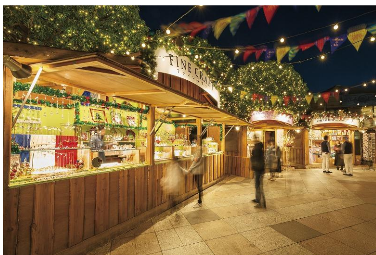
※画像は、昨年の会場イメージ