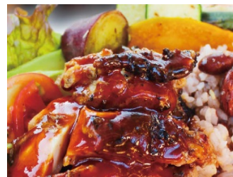
ISLAND KITCHEN 「ジャークチキンとマルシェサラダ」 M700円 L950円

内容：自然体験気分を盛り上げるCamp foodのキッチンカーが日替わりで登場。産直野菜をふんだんに使った料理を是非お楽しみください。