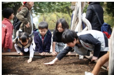
過去開催時の様子