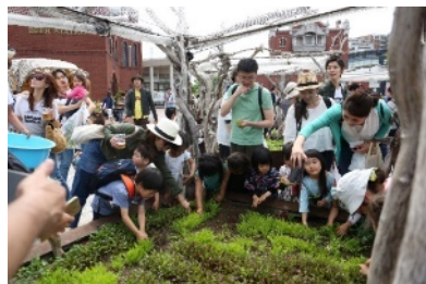
過去開催時の様子