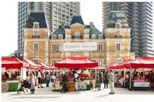
過去開催時の様子