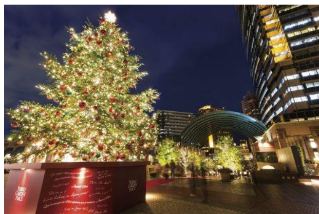
※画像は、昨年度の時計広場の会場風景となります。