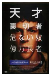
『ソーシャル・ネットワーク』