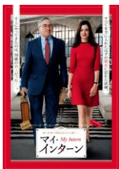
『マイ・インターン』

©2015 Warner Bros. Entertainment Inc. and Ratpac-Dune Entertainment LLC. All rights reserved.