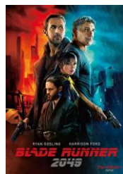
『ブレードランナー 2049』