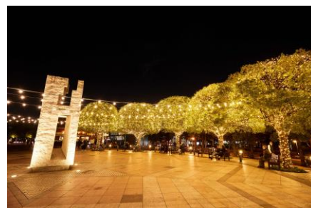
<過去開催時の様子>