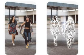
「Through the Lens」イメージ