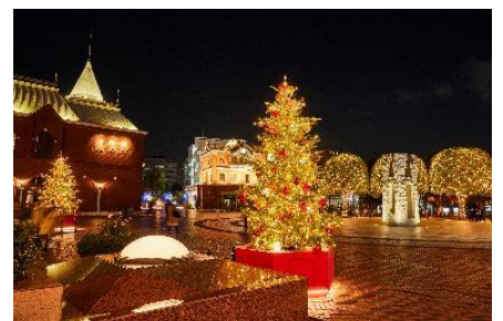
＜過去開催時の様子＞