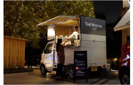
＜過去開催時の様子＞