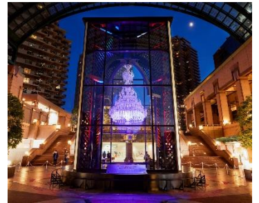
「バカラシャンデリア」光の演出 過去開催時の様子