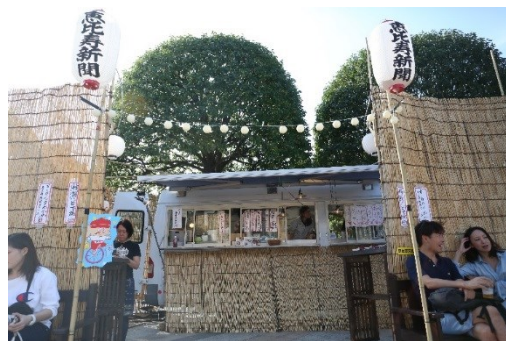
＜過去開催時の様子＞

内 容： 駅から2km半径に1900店舗の飲食店が軒を 連ねる「食の街 恵比寿」。その腕利きの料理人 の協力を得て恵比寿文化祭でしか食べられない 恵比寿らしい料理を恵比寿新聞がコーディネート。 メニューは当日のお楽しみです。