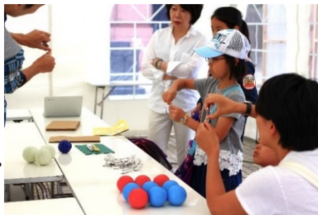
<過去開催時の様子>