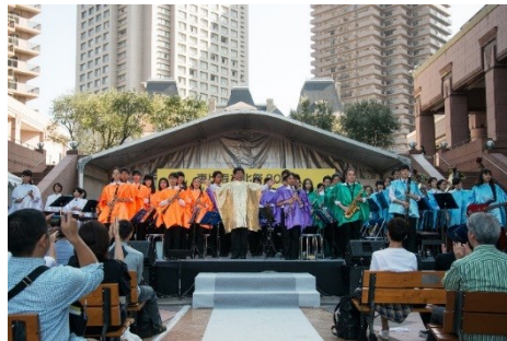
＜過去開催時の様子＞

内 容： 「日本一楽しくて上手いバンド」を目指して活動し、 中学・高校共にコンクール金賞を受賞している 吹奏楽団。今年の合言葉は「調和」。最近では 生徒自身で練習内容を組み立てて、曲を仕上げ ています。今回演奏するのは『ジブリメドレー』や『宝島』。