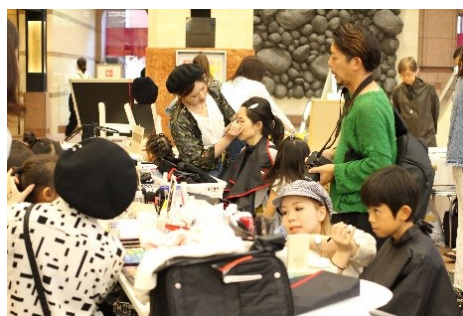
<過去開催時の様子>

内 容： ファッション業界を目指す学生たちが作り上げる「子どもファッションマーケット」。各校の得意分野を生かして、親子で楽しめるお店を開きます。エステサロン、ネイルサロン、フェイスペインティング、ファッショングッズの販売を親子でお楽しみ下さい。