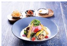
LUCIS GARDEN 恵比寿(39F)

https://gardenplace.jp/special/top_of_yEBISU/